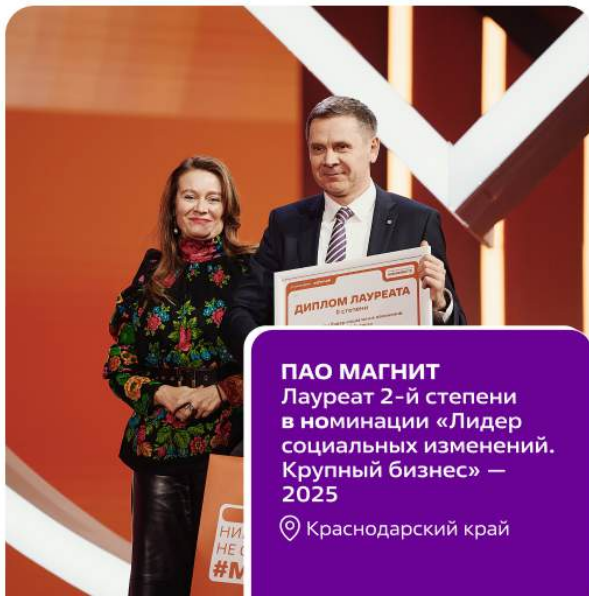
ПАО МАГНИТ Лауреат 2-й степени в номинации «Лидер социальных изменений. Крупный бизнес» — 2025 📍 Краснодарский край

присуждается за значимые проекты, реализуемые малыми, средними и социальными предпринимателями